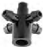
Adaptor 4 iesiri