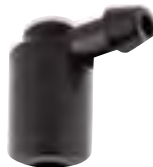
Adaptor unghiular 1 iesire