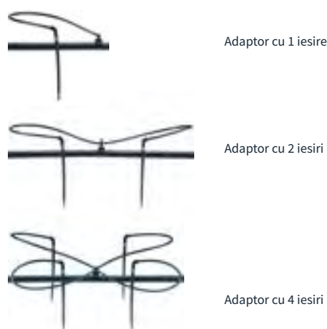
Adaptor cu 1 iesire