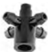
Adaptor 4 iesiri