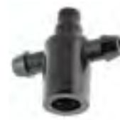
Adaptor 2 iesiri