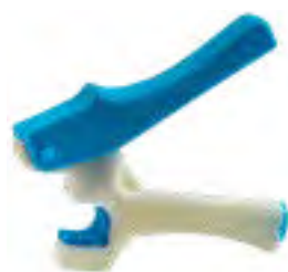
Preducea 2,5 mm