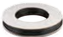
Conductă PVC/PE 3*5 mm