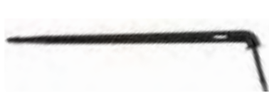
Spike picurare labirint