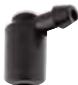
Adaptor unghiular 1 iesire